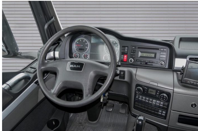
MAN | TopUsed