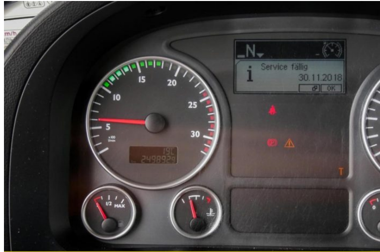
MAN | TopUsed