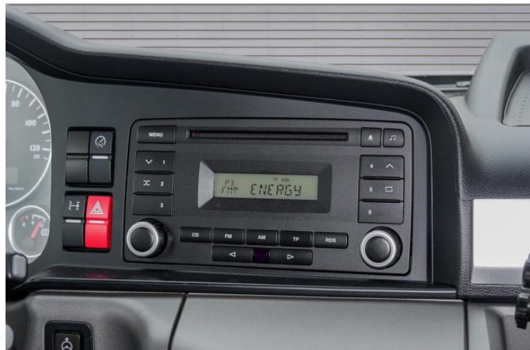
MAN | TopUsed