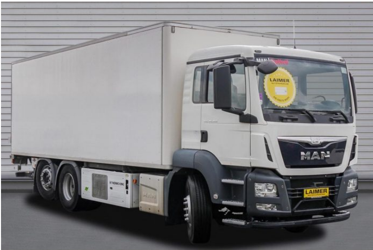
MAN | TopUsed