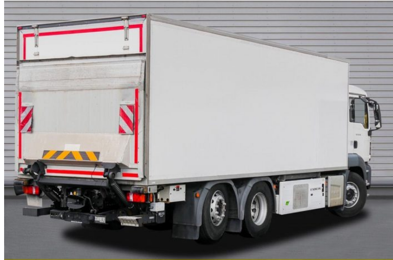
MAN | TopUsed