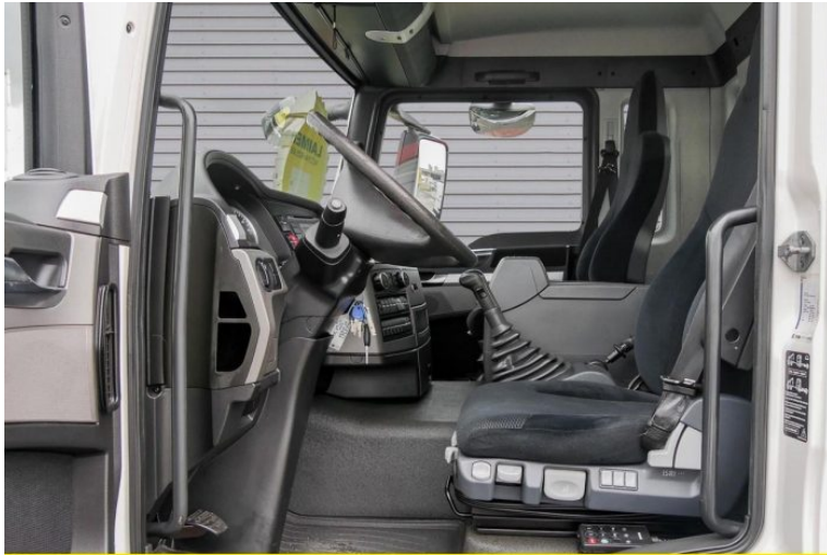
MAN | TopUsed

by LAIMER Nutzfahrzeuge e.U. & LAIMER Kraftfahrzeugtechnik GmbH