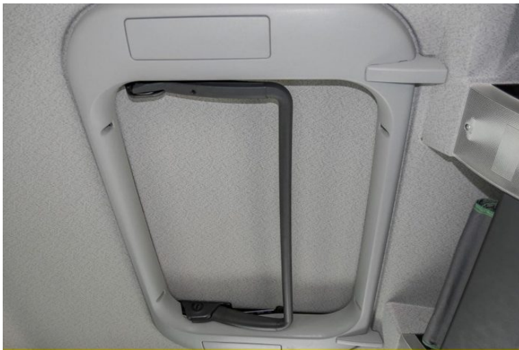
MAN | TopUsed