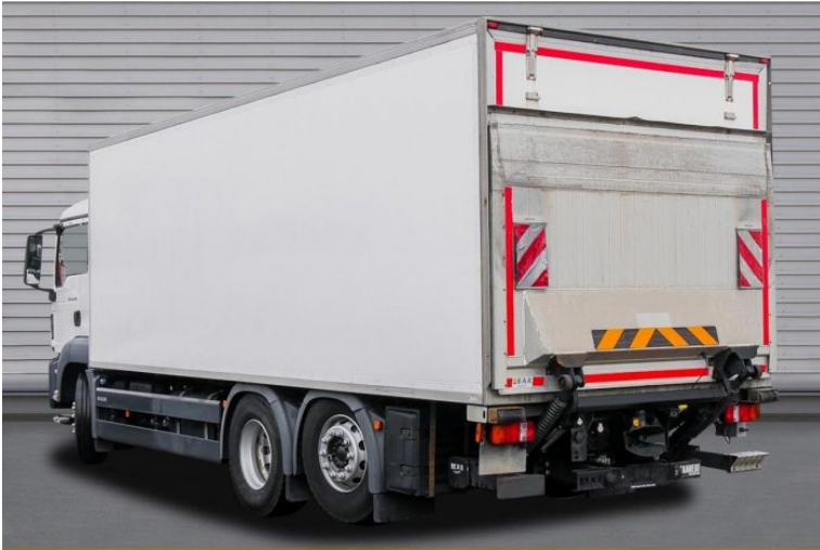
MAN | TopUsed

by LAIMER Nutzfahrzeuge e.U. & LAIMER Kraftfahrzeugtechnik GmbH