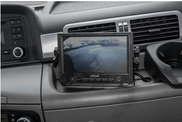
MAN | TopUsed