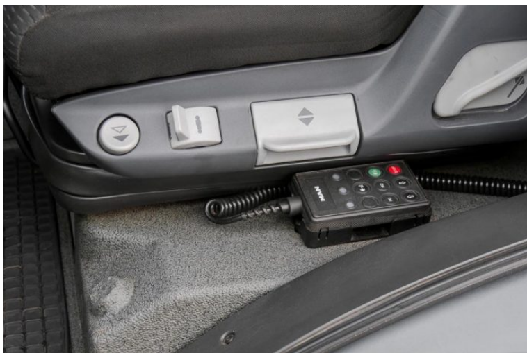
MAN | TopUsed