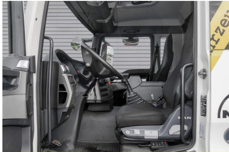
MAN | TopUsed