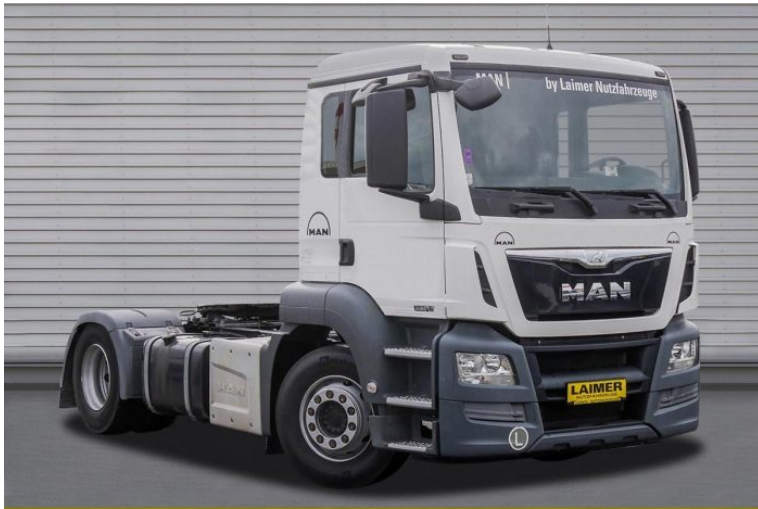
MAN | TopUsed

by LAIMER Nutzfahrzeuge e.U. & LAIMER Kraftfahrzeugtechnik GmbH