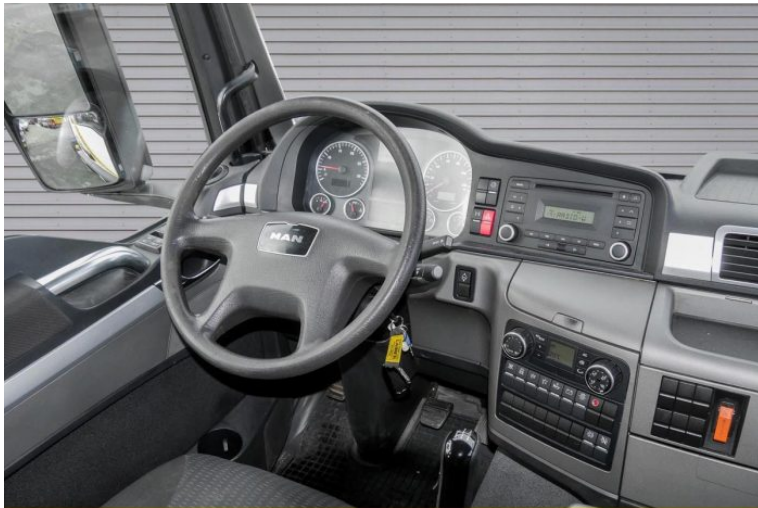
MAN | TopUsed