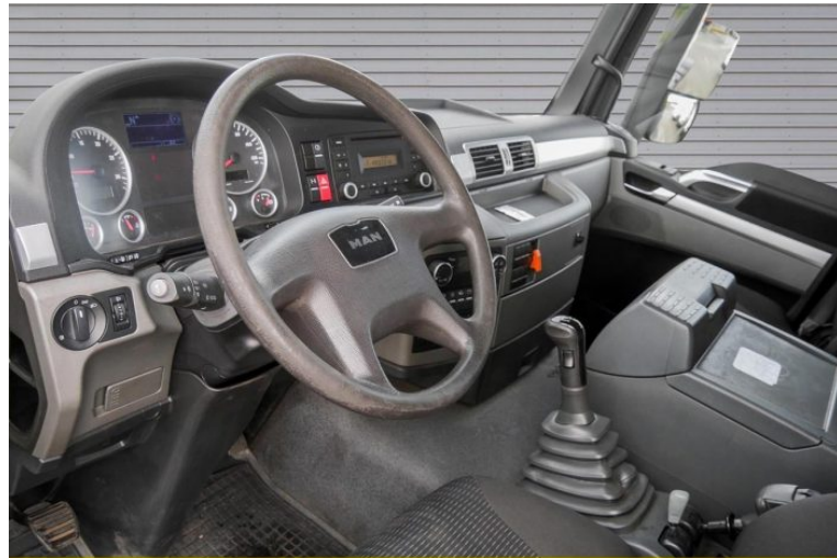
MAN | TopUsed