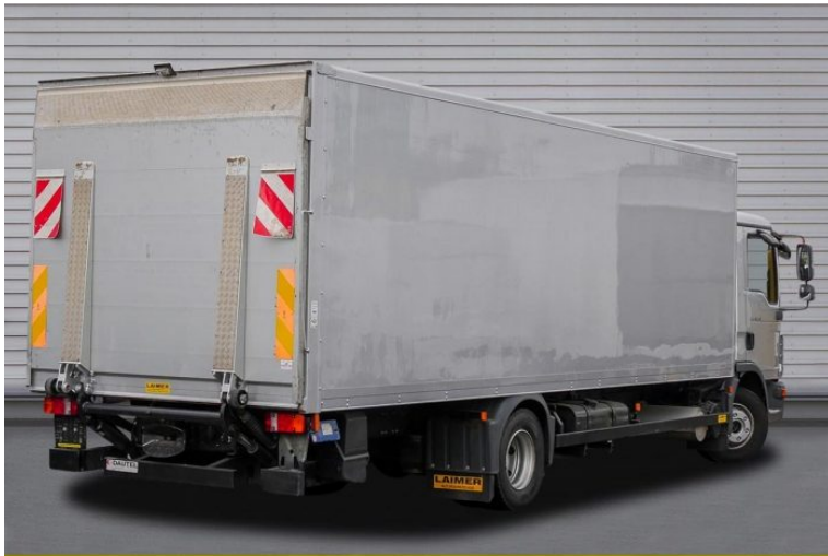
MAN | TopUsed

by LAIMER Nutzfahrzeuge e.U. & LAIMER Kraftfahrzeugtechnik GmbH