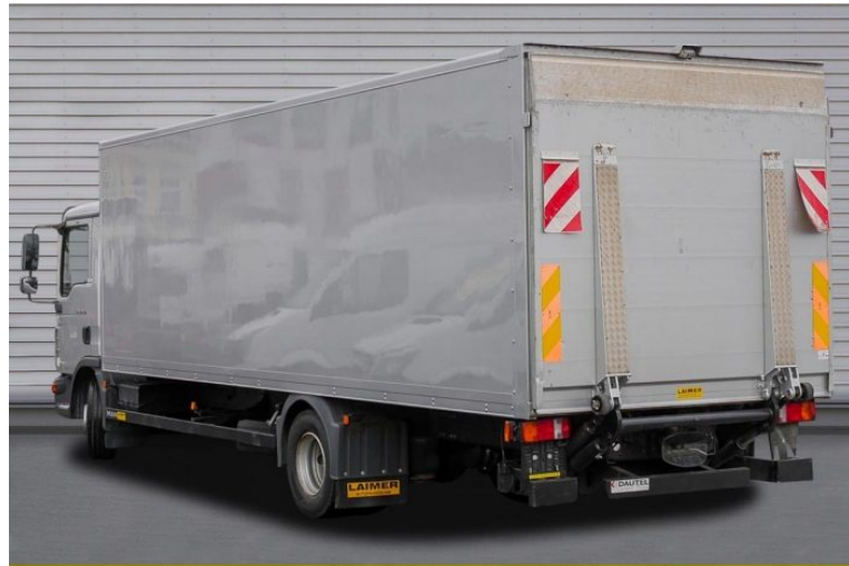
MAN | TopUsed