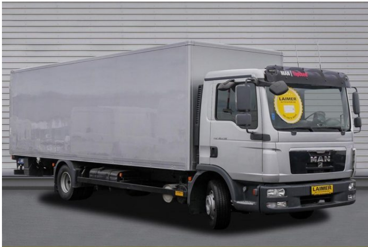
MAN | TopUsed