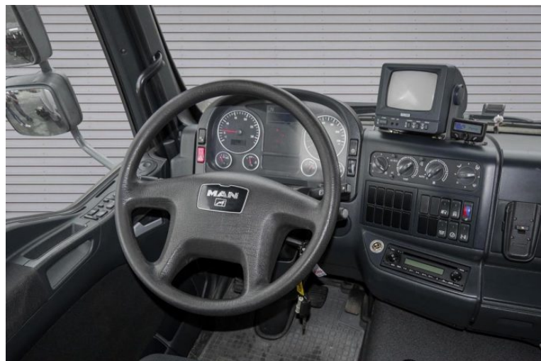
MAN | TopUsed